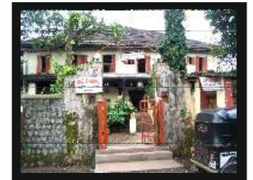
नाईकांच्या माडीचे प्रवेशद्वार