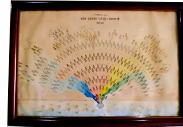
अणजूरकर नाईकांची वंशावळ