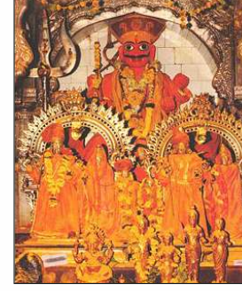
अणजूर नाईक घराण्याचे कुलदैवत श्री खंडोबा, जेजुरी