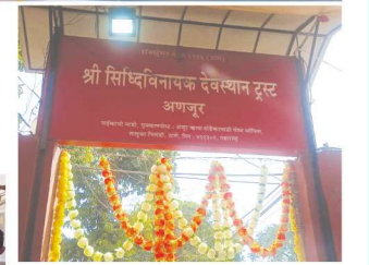
अंजूर येथील पुरातन गणेश मंदिरात ७५ वा माघी गणेशोत्सव साजरा