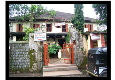
नाईकांच्या माडीचे प्रवेशद्वार