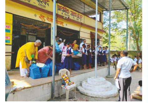
जिल्हा परिषद शाळा अंजूर शालेय विद्यार्थ्यांना शैक्षणिक साहित्य व दिवाळी फराळ वाटप