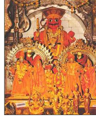
अणजूर नाईक घराण्याचे कुलदैवत श्री खंडोबा, जेजुरी

NEFT ने देणगी देणाऱ्यांनी आपला तपशील (नाव, देणगीची रक्कम, देणगीचा विनियोग, संपूर्ण पत्तासहित) anjur.siddhivinayak@gmail.com या ई-मेलद्वारे कळवावा. देणगीदारांना पावती पोष्टाद्वारे पाठविण्यात येईल.