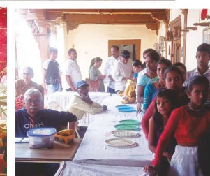
अमृत वर्ष (७५) माघी श्री गणेश जयंती उत्सव

दिवाळी - दिवाळी हाच अर्थ प्रसन्न, भाग्य, भावनेची निरीक्षण हा अर्थही असतो. ही उत्सव म्हणून साजरा केला जातो. या दिवशी देवाची स्तुती करून त्याच्याशी प्रार्थना करून त्याची कृपा मागली जाते. दिवाळीच्या दिवशी देवाची स्तुती करून त्याच्याशी प्रार्थना करून त्याची कृपा मागली जाते. दिवाळीच्या दिवशी देवाची स्तुती करून त्याच्याशी प्रार्थना करून त्याची कृपा मागली जाते. दिवाळीच्या दिवशी देवाची स्तुती करून त्याच्याशी प्रार्थना करून त्याची कृपा मागली जाते.